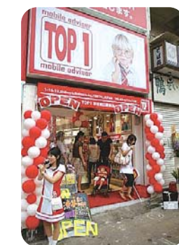
「渋谷駅徒歩1分」「原宿駅徒歩30秒」と、利便性を考えた店舗はどれも超駅近。

また、月間MVP、新人MVP、CIS(Customer Impressive Satisfaction: 顧客感動満足)MVPの3部門で毎月MVPを選出。社員の投票により決定したMVPは全体会議で表彰される。ひと際目を引くCISのMVPは、社内のイントラネットブログに寄せられた、お客様との間に起きたエピソードが表彰の対象となっている。