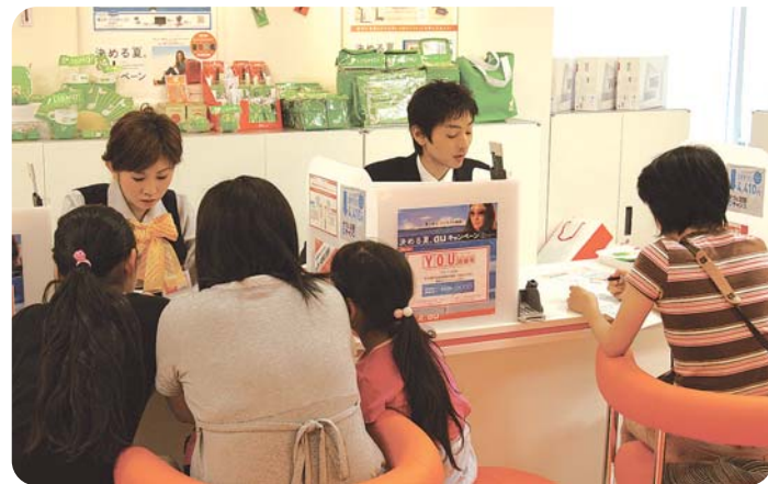
写真上：『感情移入接客』を合言葉に、お客様一人ひとりに手を差し伸べられるような思いやりのこもった接客を目指すスタッフ。時間をかけ心を込めた分、お客様との信頼関係は厚い。 写真左：お客様連れのお客様にも安心して来店頂けるよう、クレンリネスに気を遣い、キッズルームを設けるなどの工夫を施す。

従来の携帯ショップのイメージからは想像し得ないエピソードの数々。これらのエピソードを生む元となる、お客様との強い信頼関係を構築できる人材は、先の教育制度の中で育てられるばかりではない。同社では、上司が自らの体験談を部下に語り、上司がお客様との実際のやりとりを元に、会社が目指す『感情移入接客』の姿や意義を互いに確認しあう格好だ。部下にとっては、より実践に近い形で理念のエッセンスを吸収できる機会となる。