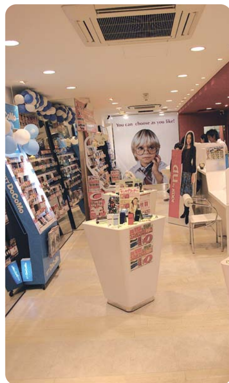
販売方法の変更やMNP制度の導入で消費者の購入視点にも変化が、複数のキャリアを扱う総合型携帯ショップでは、接客の中にもより具体的な提案が求められる。

『クレド』に始まる理念浸透に向けた取り組み 「感情移入接客」の考え方や姿勢、理念の浸透に向け、同社では「クレド」の作成や、階層別・テーマ別研修の実施、毎月のMVP表彰など、様々な取り組みを行っている。 「クレド」は同社の経営哲学を綴ったもので、社員が立ち返るべき行動指針を18項目にまとめている。5年ほど前に幹部社員らによって作成された。「自分たちで作ったもので、いかに浸透させていくかを常に考えている」と吉岡氏が語る通り、社内ではクレドを振り返る機会が多く、新入社員にはクレドのテストも実施。人事評価制度にもクレドの実践度合いの評価項目が設定され、形骸化させないための