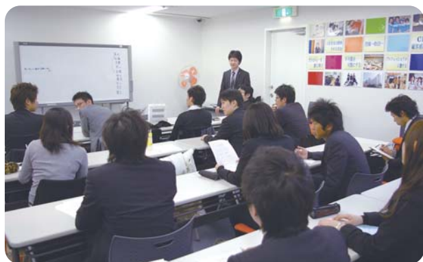
人財教育に力を入れる同社は、研修制度も徐々に構築中。現在は階層別に15に渡るテーマで実施している。理念研修からコンプライアンスまで扱うテーマも様々。